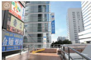
⑤ 新生銀行を正面に左側の階段を降りてください