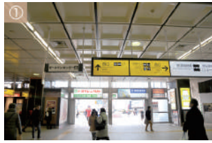
① JR 大宮駅西口よりお越しください