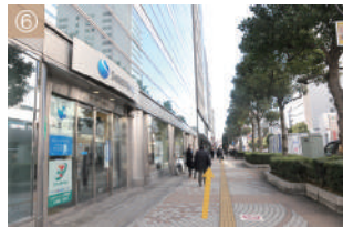
⑥ 新生銀行を左手に直進ください