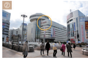
② 西口を背にそごうへ向かって歩道橋の上をお進みください