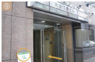
⑨ こちらが入り口で3階がクリニックです（看板有り）

大宮駅西口を出て、そごうのある駅前大通りの左側を直進します。 新生銀行の前を通過し、さらに進むと角に大宮センタービルの青い看板がありますので左に曲がります。 当院の看板が出ているビルの3Fです。 道に迷った時はお電話下さい。ご案内します。TEL :048-649-0118