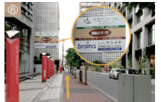
⑧ 大宮セントラルクリニックの看板を目印に直進ください